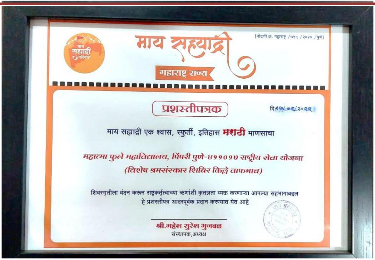
NSS unit of the College awarded for Holkar Fort cleaning at Wafgaon, Dist-Pune by My Sahaydri foundation.