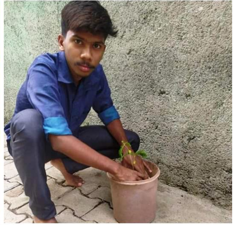
Tree plantation ( Harit Wari )